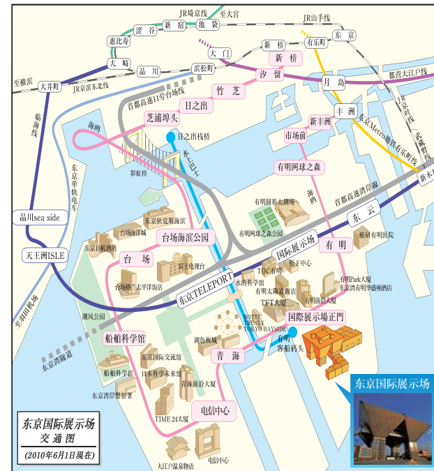
*请参照左边的地图