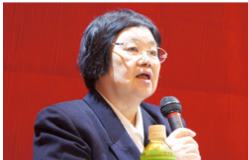
■Business Guide-Sha, Inc.