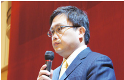
■Business Guide-Sha, Inc.