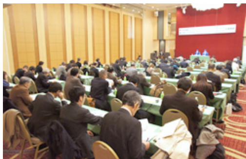
■ 现场媒体与会场景