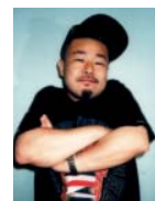
嘉宾: YASUMASA YONEHARA

作为世界上使用Cheki相机的专业摄影师而闻名的日本艺术家、摄影师与编辑于一身的米原康正。这次邀请米原先生作为Gift Show in 上海的特别嘉宾，在会场内舞台举办模特写真合影会。现在中国国内的电商平台拥有自己设计开发的女装品牌“Mija”及男装品牌“YONE”，用自己独特的方式增进中日两国的文化交流。